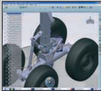
CATIA har flera eCAD-moduler, för att de ska vara optimalt användbara krävs ett PDM-system.

■ Också amerikan med programmet MG High Speed PCB Design för kretskortsdesign. Precis som Cadence har de också en produktportfölj för elektronikutveckling, design av IC-kretsar och verifiering. De har också ett speciellt program för kablage.